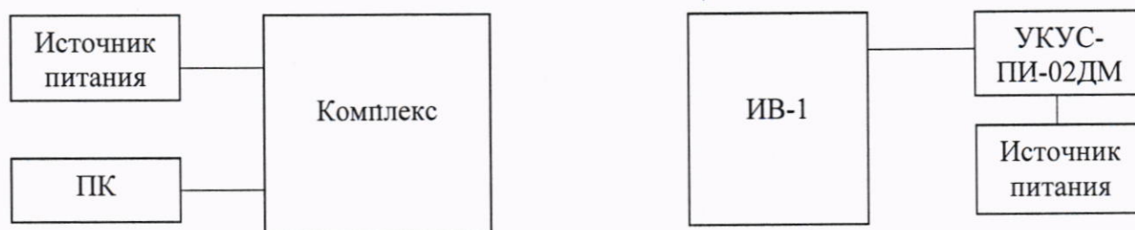
Рисунок 1 – Схема проведения измерений

10.1.1 Собрать схему в соответствии с рисунком 1.