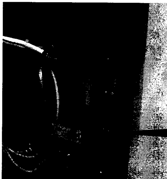
Рисунок 4 - Схема пломбировки от несанкционированного доступа