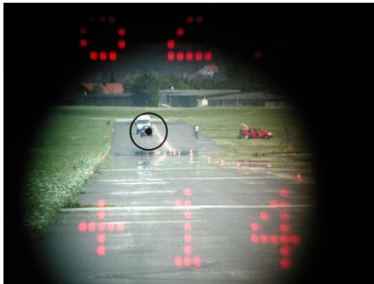
Bild links: Fahrzeug vorne korrekt angemessen, Messwert stammt trotzdem vom Wagen dahinter