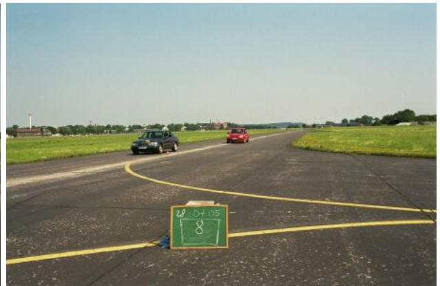
Bilder oben: Zwei Fahrzeugpositionen, wenn der hintere Wagen gemessen wurde