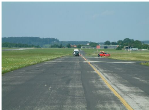
Bilder unten: Die Situation, der Blick durch die Visiereinrichtung (ohne Vergrößerungsoptik) und das Messergebnis: Es stammt vom Kastenwagen dahinter.