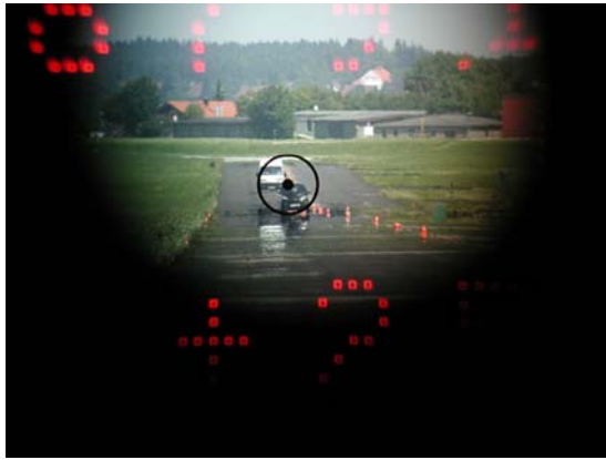
Ziel leicht verfehlt, Fahrzeug hinten gemessen