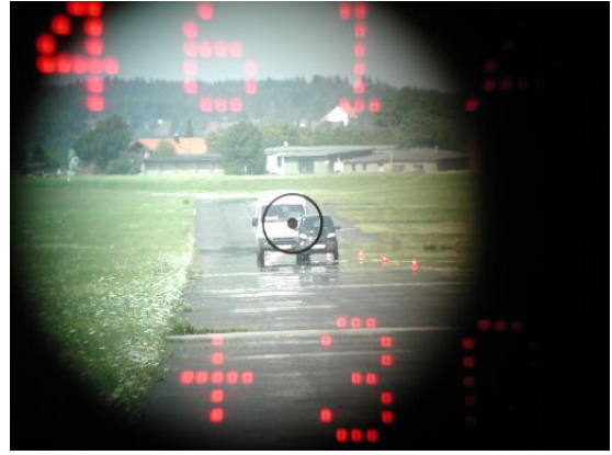
Vorderes Auto seitlich getroffen, Kastenwagen dahinter gemessen