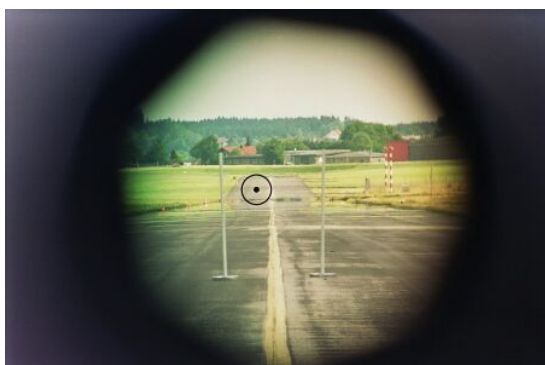
Bild oben links: Zusammengeschraubte Kennzeichen bilden einen Kreis, durch den später gemessen wurde