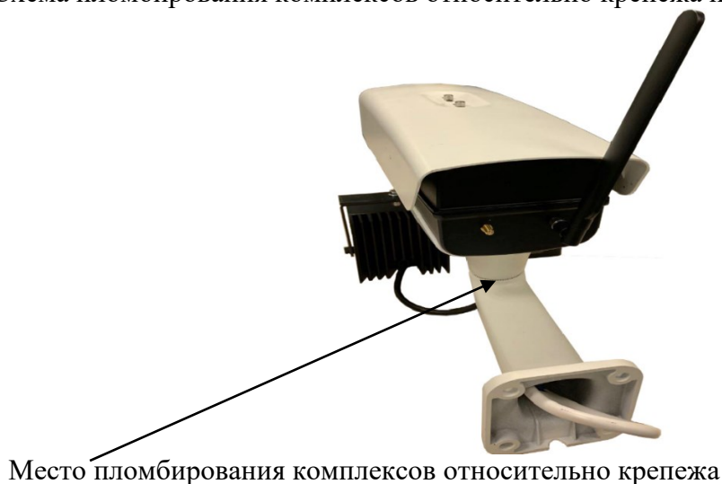
Рисунок 3 – Схема пломбирования комплексов относительно крепежа

Схема пломбирования комплексов относительно крепежа представлена на рисунке 3.