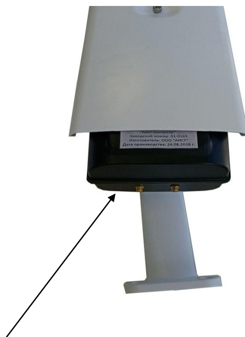
Место пломбировки от несанкционированного доступа

Схема пломбировки от несанкционированного доступа и маркировки комплексов представлена на рисунке 2.