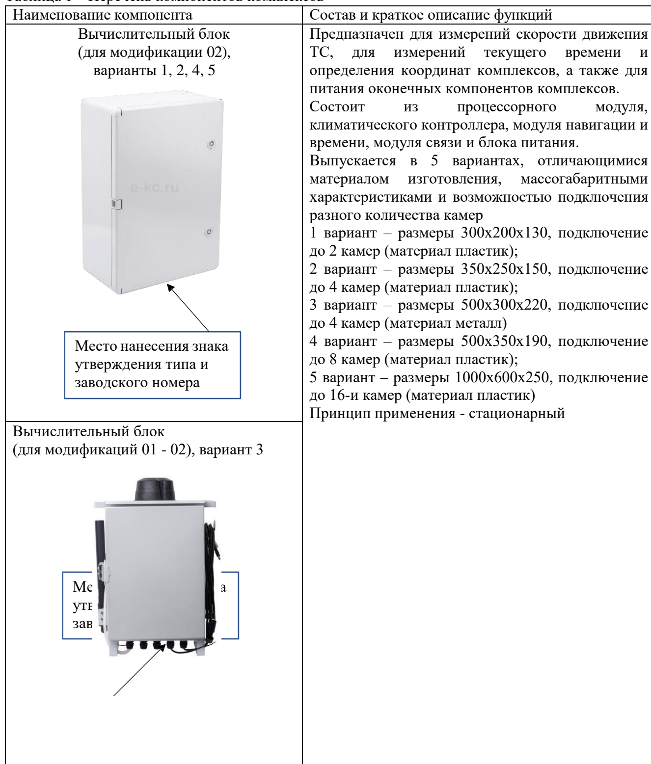
Таблица 1 – Перечень компонентов комплексов