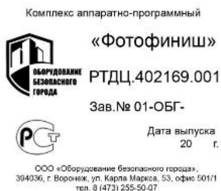
а) изготовленных ООО «Оборудование безопасного города»

Пример маркировки комплексов представлен на рисунке 5.