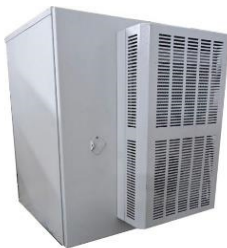
б) вычислительный модуль тип 2 (BM2)