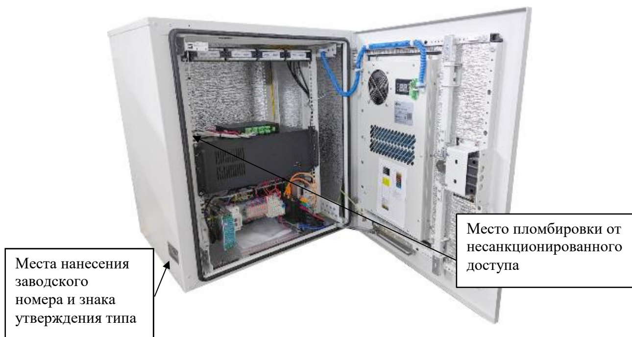
Рисунок 4 – Схема пломбировки от несанкционированного доступа, обозначение места нанесения заводского номера и знака утверждения типа комплексов модификации 3