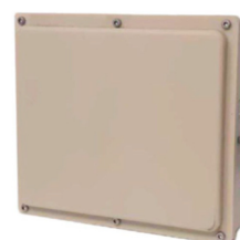
е) радарный модуль