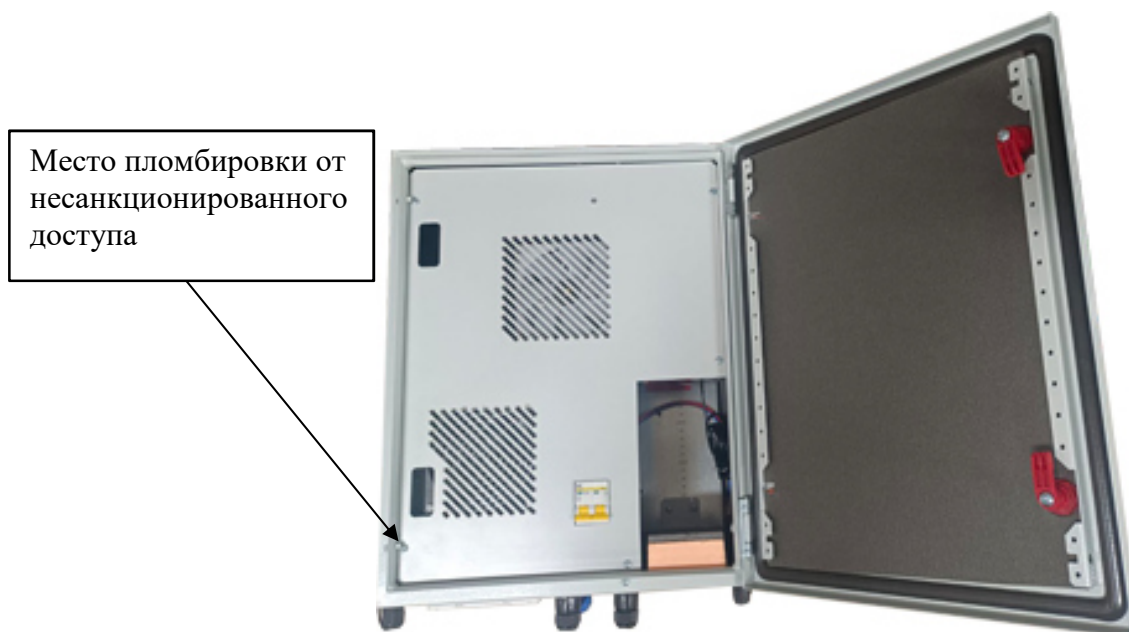
Рисунок 3 – Схема пломбировки от несанкционированного доступа комплексов модификации 1 и 2