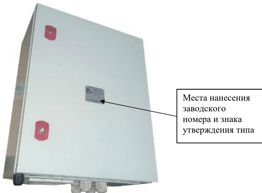
Рисунок 2 – Обозначение места нанесения заводского номера и знака утверждения типа комплексов модификации 1 и 2

Схема пломбировки от несанкционированного доступа, обозначение места нанесения заводского номера и знака утверждения типа комплексов представлены на рисунках 2 - 4.