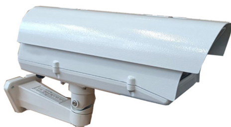
в) камера распознающая тип 1 (KP1)