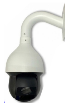
г) камера распознающая тип 2 (KP2)