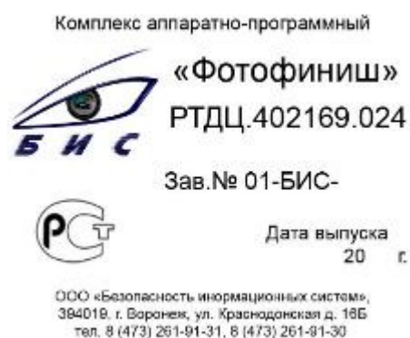
б) изготовленных ООО «БИС»