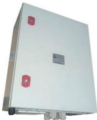
а) вычислительный модуль тип 1 (BM1)

Общий вид составных частей комплексов представлен на рисунке 1.