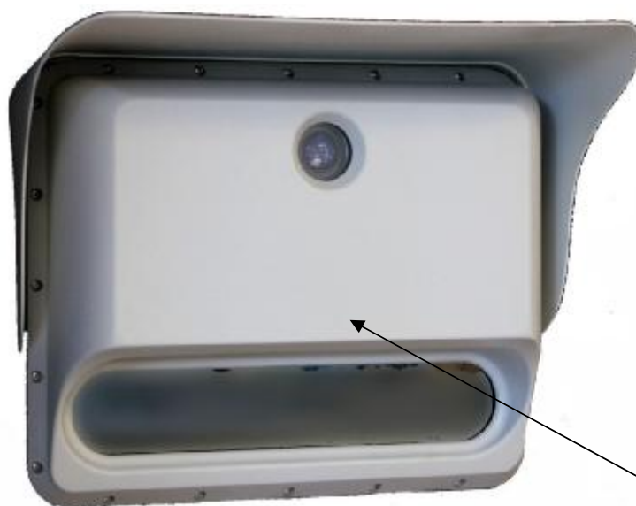
Место для размещения знака утверждения типа Рисунок 1 – Внешний вид ВРБ