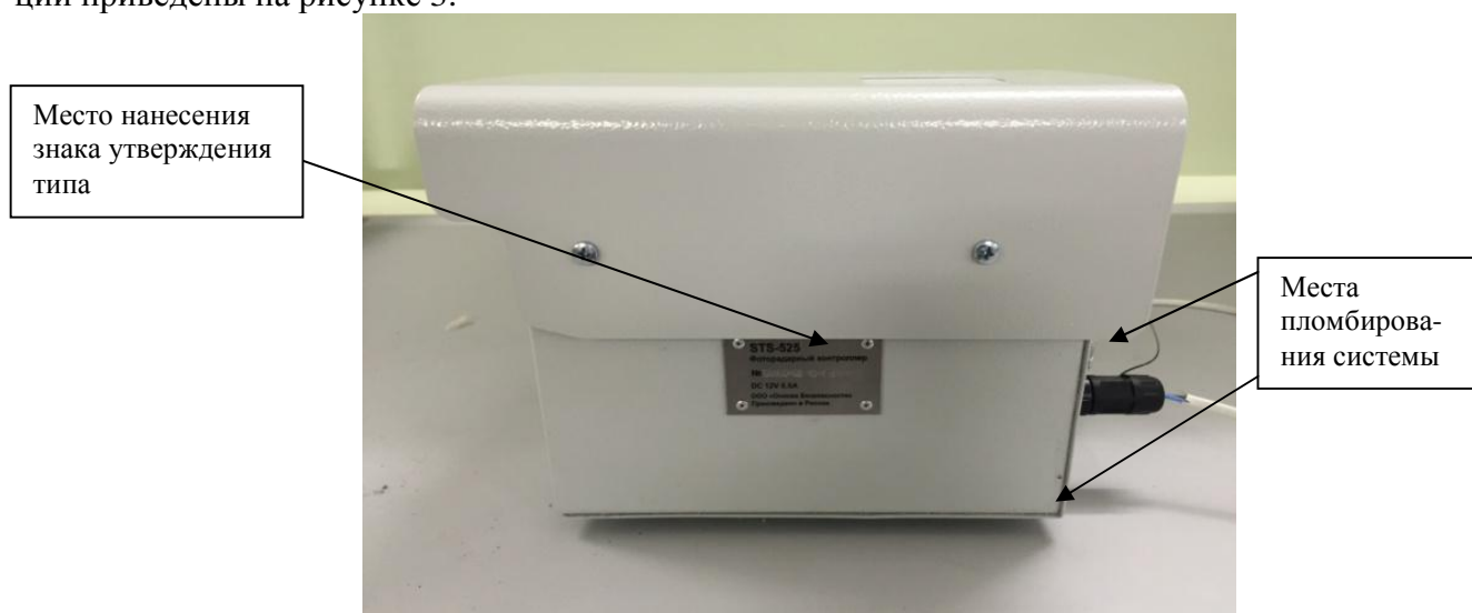
Рисунок 3 - Места пломбирования системы

Пример места пломбирования от несанкционированного доступа и места нанесения знака утверждения типа фоторадарных контроллеров и контроллеров с функцией фотофиксации приведены на рисунке 3.